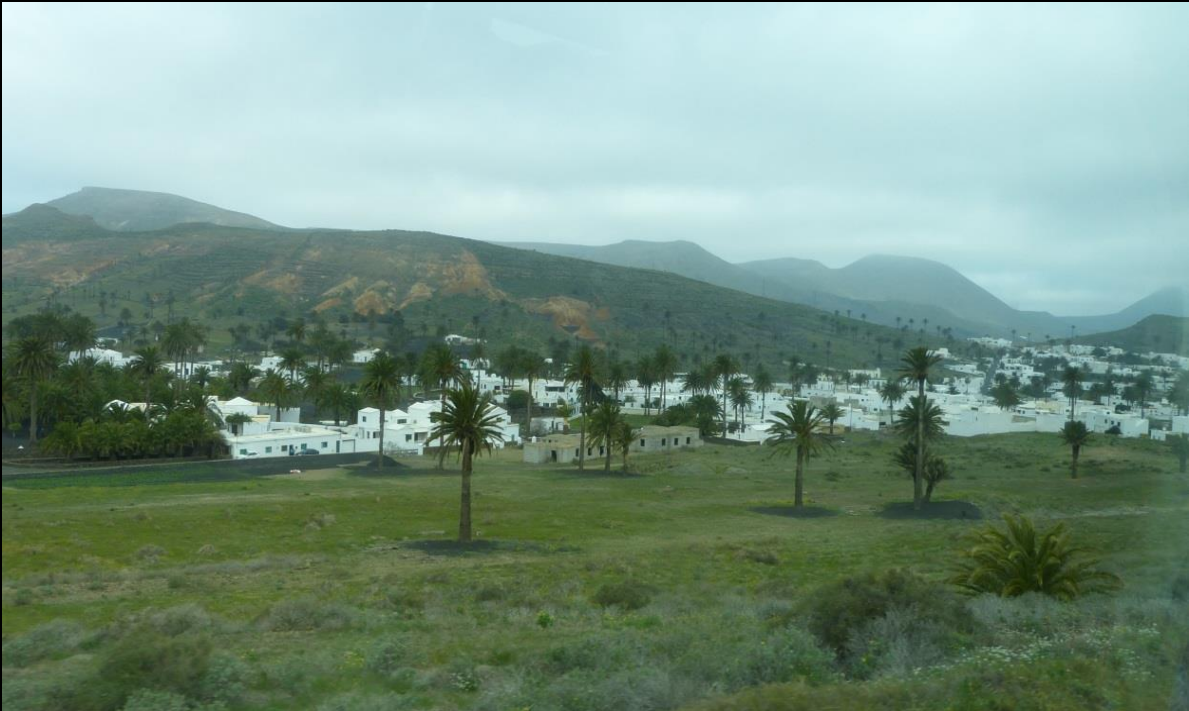
Das Tal der 1000 Palmen

Ausflug in den Norden der Insel und Arrecife