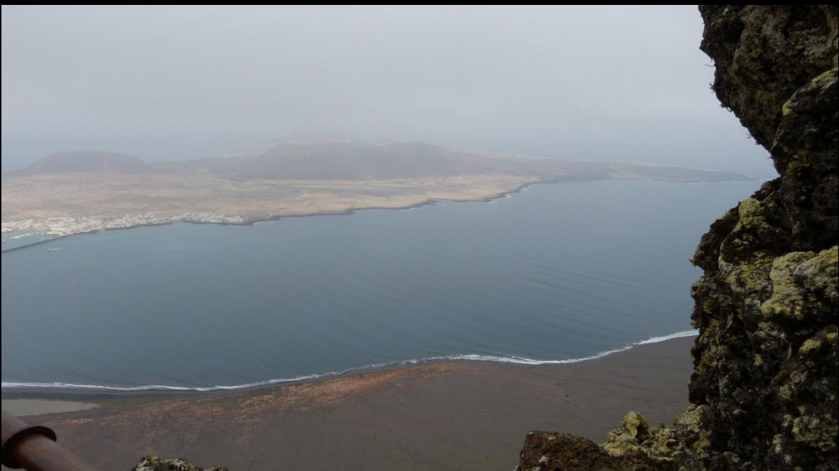
Mirador del Rio mit Blick auf die Insel La Graciosa